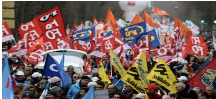
Şekil 11.2. Fransa'da emeklilik reformuna karşı genel grev. Kaynak: https://tr.euronews.com/2023/03/07/fransada-emeklilik-reformuna-karsi-genel-grev

Grev, Sendikalar ve Toplu İş Sözleşmesi Kanunu’nda işçilerin, topluca çalışmamak suretiyle iş yerinde faaliyeti durdurmak veya işin niteliğine göre önemli ölçüde aksatmak amacıyla, aralarında anlaşarak veya bir kuruluşun aynı amaçla topluca çalışmamaları için verdiği karara uyarak işi bırakmaları şeklinde tanımlanmıştır. Grev, toplu iş bırakma olduğundan dolayı toplum yaşantısını derinden etkileyebilme potansiyeline sahiptir, bu sebeple kanunda detaylı bir şekilde düzenlenmiştir. İşçiler greve katılıp katılmamakta serbesttir. Greve katılmayan işçilerin iş yerinde çalışmaları hiçbir şekilde engellenemez. Greve katılan veya lokavta maruz kalan işçilerin iş yerine giriş ve çıkışı engellemeleri yasaktır. Grev başlamadan önce üretilen veya grev esnasında greve katılmayan işçilerin ürettikleri ürünlerin satılmasına ve iş yeri dışına çıkarılmasına engel olunamaz.