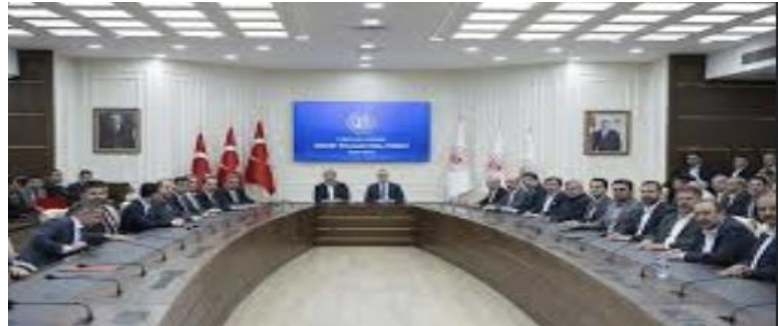
Şekil 11.1. Toplu Görüşme: Kaynak: https://www.aa.com.tr/tr/gundem/7-donem-kamu-toplu-sozlesmesinde-kismi-anlasma-saglandi/2973970

Toplu pazarlığın işçi tarafını, işçileri temsilen sendikalar oluşturmaktadır