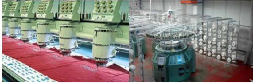
Resim 3.1 Gürültü yapan makineler

İnsanın ruhsal ve fiziksel yapısını olumsuz yönde etkileyen gürültüyü tanımlayabilmek için, sesin fiziksel nitelikleri ve işitme konusuna değinmekte yarar vardır.